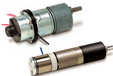
電磁ブレーキ Electromagnetic Brake