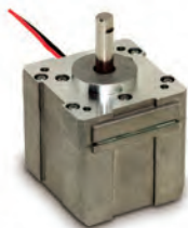
ブラシレスモータ Brushless motor