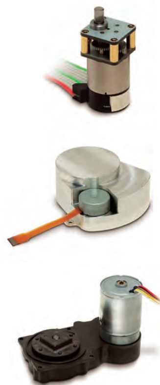
特殊形状ギヤヘッド Special configuration gearhead