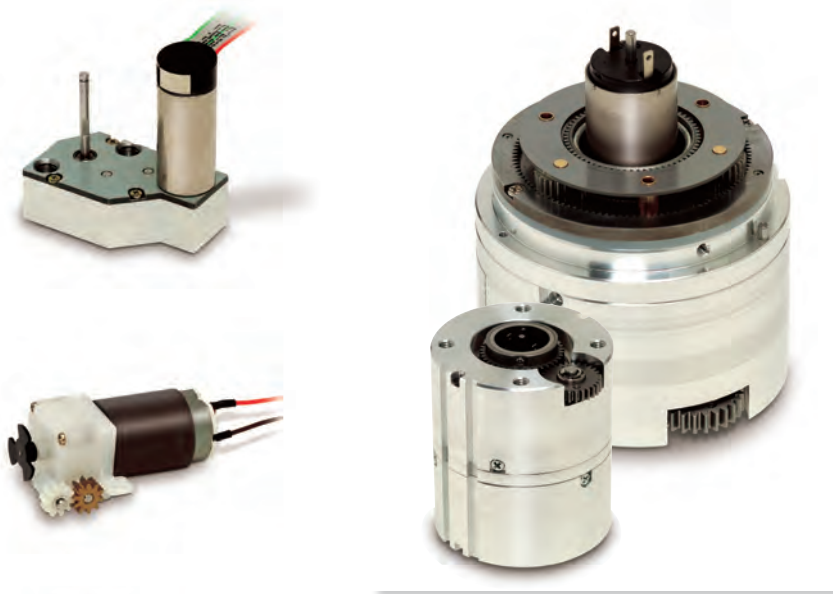
不思議遊星ギヤヘッド Paradox Planetary gearhead